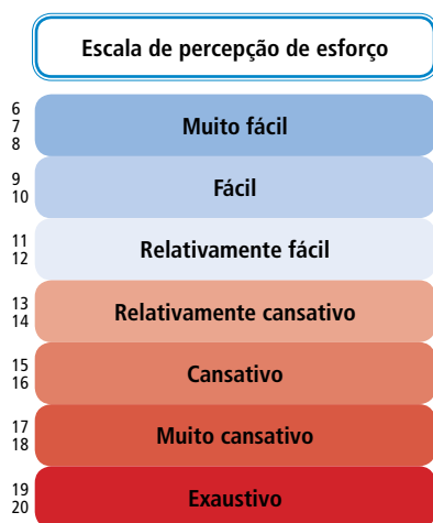
Figura 2. Escala de Esforço Percebido de Borg

Desse modo o programa de caminhada deverá ter os parâmetros demonstrados no quadro 15.